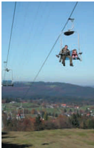
Gemütlich schwebt die Sesselbahn zu den drei Hörnle hinauf

Im Sommer wandern, im Winter rodeln. Das Hörnle ist zu allen Jahreszeiten ein attraktives Ziel für Familien. Gleich drei Gipfel können vom Hörnle-Plateau aus bestiegen werden: das Vordere, das Mittlere und das Hintere Hörnle. Ihre Namen tragen diese Berge zu Recht - wie Spitzkegel ragen sie auf und laden geradezu dazu ein, erklommen zu werden. Da sie nicht felsig sondern grasbedeckt sind, ist der Aufstieg auch für Kinder relativ ungefährlich. Mit der Hörnle-Schwebebahn - einem Doppelsessellift - gelangt man vom 900 Meter hoch gelegenen